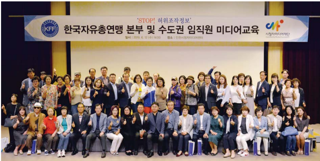
◇6월 12일 송도동 인천시청자미디어센터에서 열린 허위조작정보 근절을 위한 미디어 교육.

한국자유총연맹(총재 박종환, 이하 자총)이 허위조작정보 근절을 위해 지부별로 진행하고 있는 미디어교육이 회원들의 적극적인 참여 속에 활발하게 진행되고 있다.